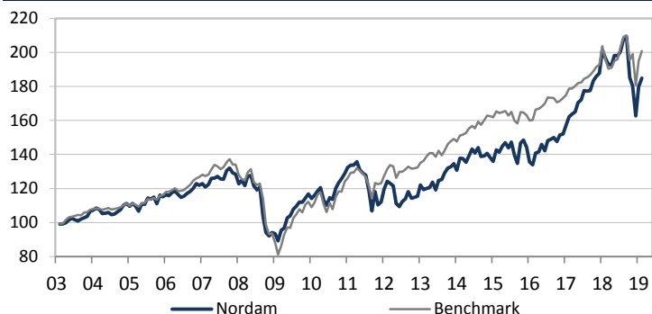
Archea Nordam Benchmark